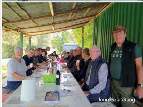
Journée à l'étang