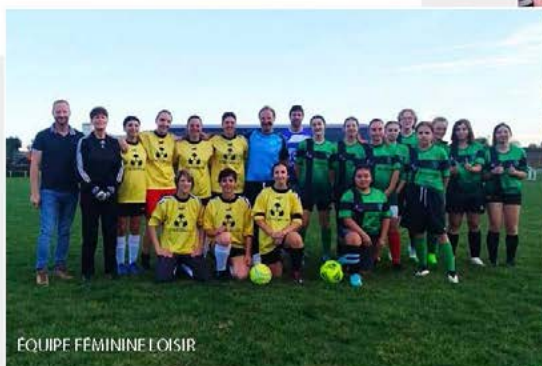
ÉQUIPE FÉMININE LOISIRS

Enfin, la fin de saison a été marquée par la constitution d'une équipe féminine Loisirs dont le but initial est de s'entraîner ensemble et de s'amuser. D'abord composé de 5 joueuses, ce groupe compte aujourd'hui une douzaine de participantes assidues et envisage d'organiser des matchs amicaux contre des équipes homologues d'autres clubs.