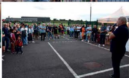
INAUGURATION DU COMPLEXE SPORTIF