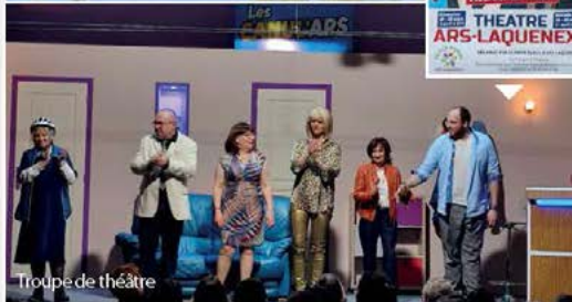
Troupe de théâtre