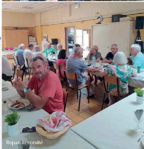
Repas du comité