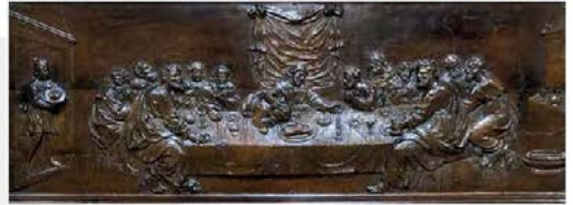
La cène sculpture figurant sur l'ancien autel de l'église